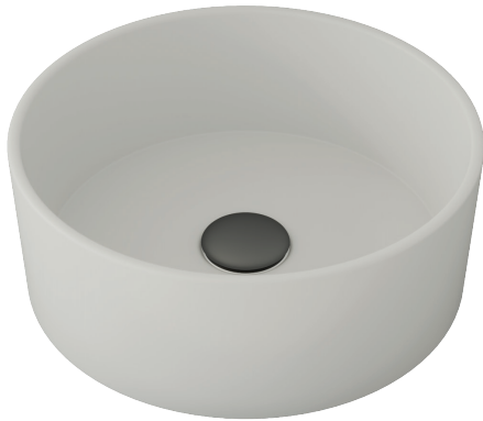
FINITURA LISCIA ø37cm h13cm