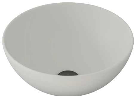
FINITURA LISCIA ø40cm h16 cm